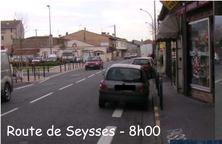
Route de Seysses - 8h00