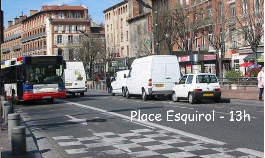
Place Esquirol - 13h