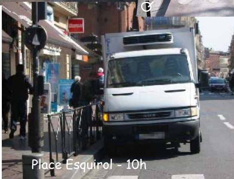
Place Esquirol - 10h