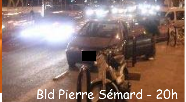
Bld Pierre Séward - 20h