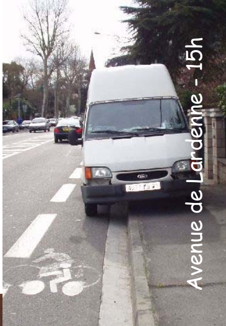
Avenue de Lardenne - 15h