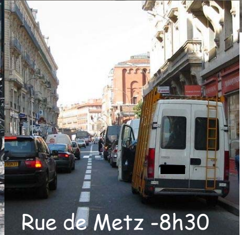
Rue de Metz - 8h30