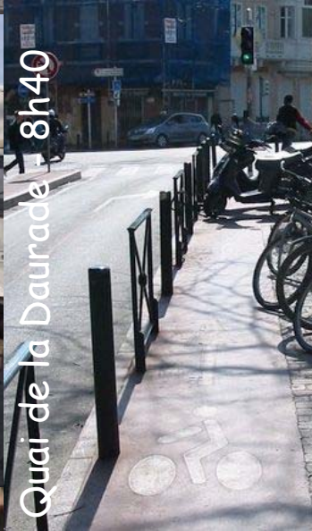
Quai de la Daurade - 8h40