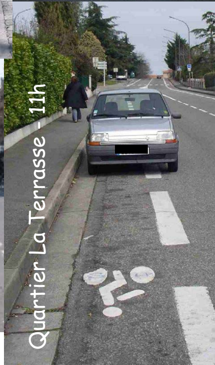
Quartier La Terrasse - 11h