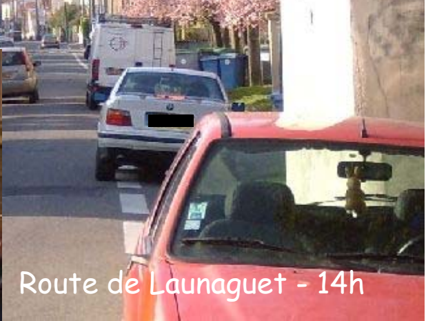
Route de Launaguet - 14h