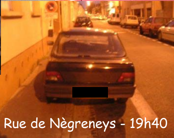
Rue de Nègreneys - 19h40