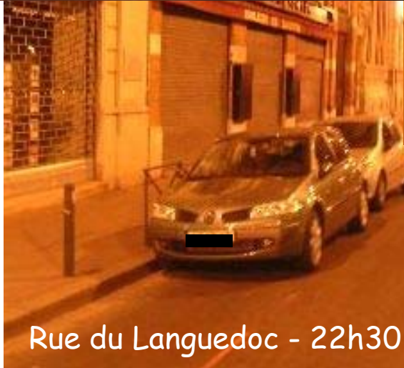
Rue du Languedoc - 22h30