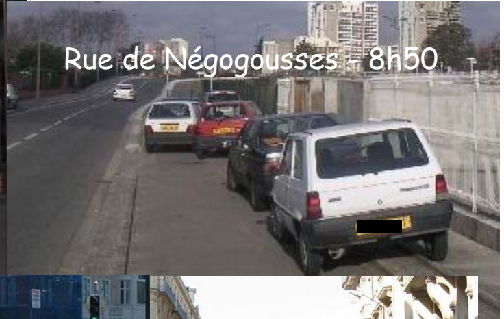
Rue de Négogousses - 8h50