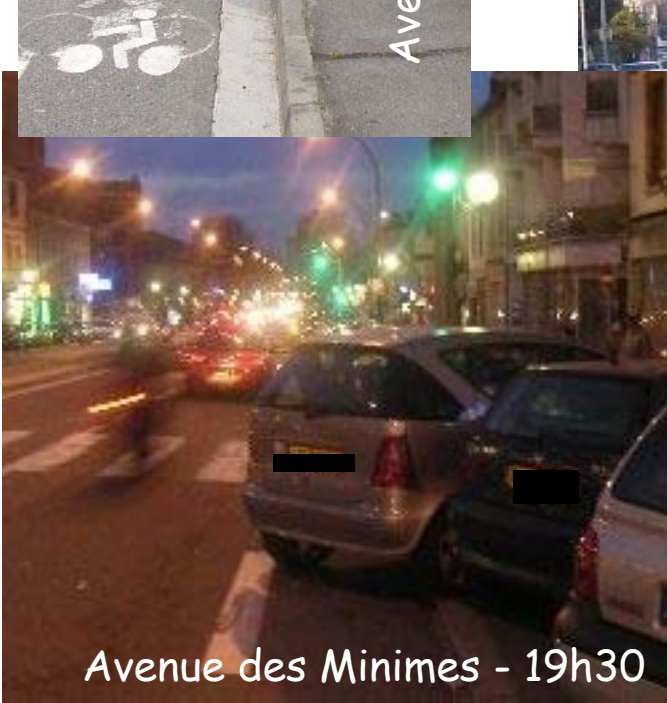
Avenue des Minimes - 19h30