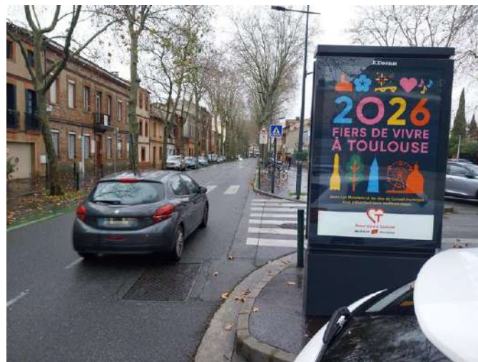
Un panneau publicitaire jugé illégal, avenue Crampel à Toulouse.

Pistes cyclables coupées, passages piétons masqués, trottoirs trop étroits... L'association Deux Pieds Deux Roues dénonce une série de panneaux publicitaires et d'abribus installés en infraction avec la loi, dans les rues de Toulouse.