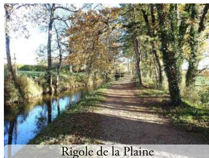
Rigole de la Plaine

Pour le retour emprunter le même chemin car traversée dangereuse de la D6113. Au pont du Ségala variante : emprunter le bord du canal (V80), qui rejoint le pont de Montferrand. Ou suivre la Voie Verte du canal (V80) en direction de Castelnau-d'Aud, ... Le seuil de Naurouze, c'est une plaque tournante pour des balades faciles et ombragées.