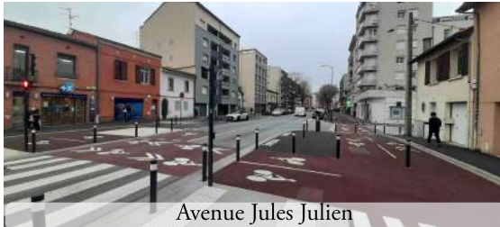
Avenue Jules Julien

L'avenue Jules Julien est le beau cadeau 2025.