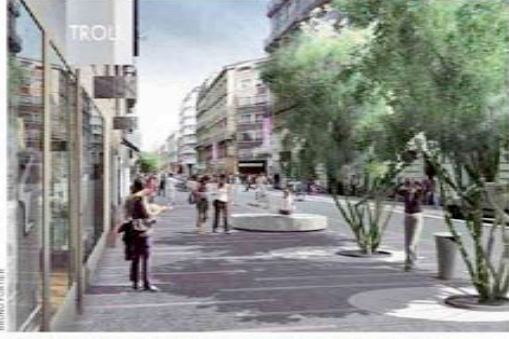
La rue Alsace pourrait se transformer en un vaste plateau à priorité piétonne.

Plateau piétonnier en question Sa version finalisée doit être rendue dans un mois et demi. D'ici là, l'architecte-urbaniste Bruno Fortier aura tranché plusieurs questions. Et notamment la façon dont il va pouvoir réduire