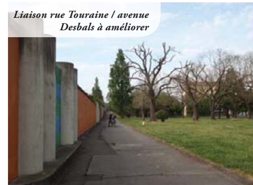
Liaison rue Touraine / avenue Desbals à améliorer