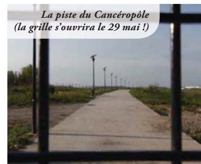
La piste du Cancéropôle (la grille s'ouvrira le 29 mai !)