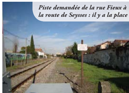
Piste demandée de la rue Fieux à la route de Seysses : il y a la place