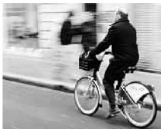
Le succès des VêlôToulouse de mande pour beaucoup une extension du service au-delà de 2 heures du matin.

Les 253 stations en libre-service Vêlô-Toulouse, dont la dernière vient d'être mise en service, ont participé à ce changement. « Aujourd'hui, nous avons 2 400 bicyclettes et nous comptabilisons environ 10 000 locations par jour », se