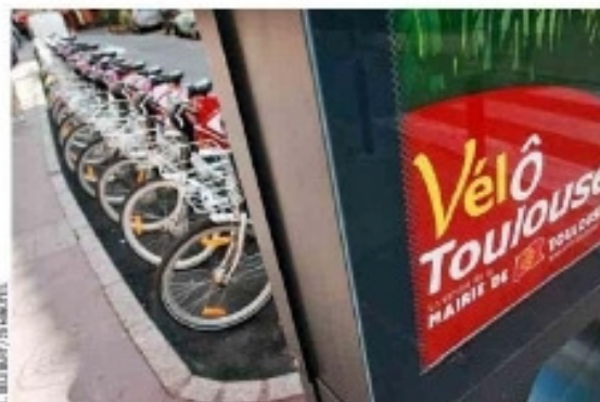
La Ville rose compte 2 400 vélos en libre-service répartis dans 253 stations.