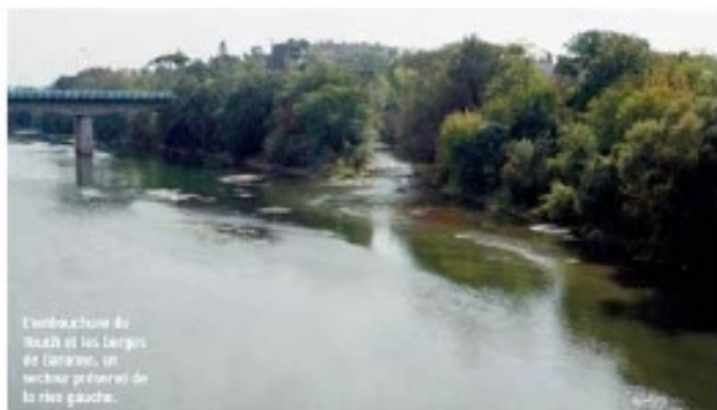
L'embouchure du Touch et les berges de Garonne, un secteur préservé de la rive gauche.