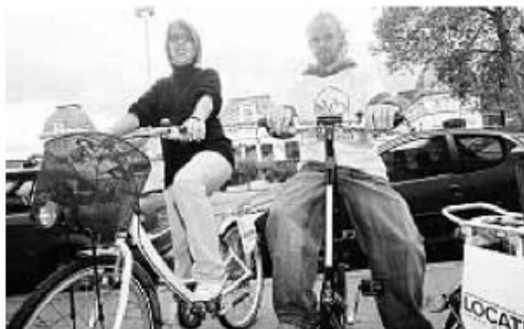
Depuis cet été, la Maison du Vélo propose des vélos pliants pour se déplacer dans les transports en commun.