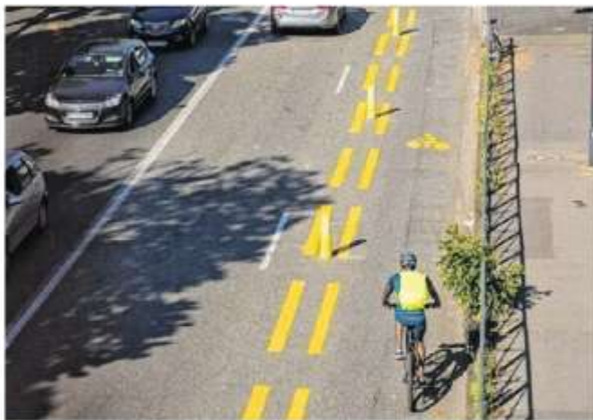
De nouveaux axes réservés aux cyclistes sont aménagés sur le territoire de Toulouse métropole.