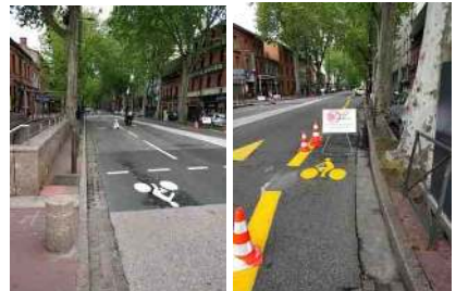
Les pistes provisoires avenue E. Billières