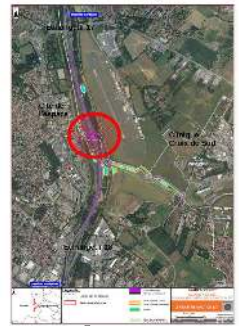
Le projet

• D'attendre, avant toute déclaration d'utilité publique, d'avoir mesuré l'incidence sur la circulation automobile de la prolongation du bus L1 (ligne la plus fréquentée de Toulouse avec 23000 voyageurs/jour en 2017) vers Entiore et la Clinique Capio et du développement du L7 vers Saint Orens.