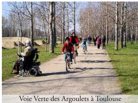
Voie Verte des Argoulets à Toulouse

Commentaire JS : J'approuve les arguments de S. Banoun. Les Voies Vertes sont des espaces partagés entre cyclistes, piétons et assimilés, dont les personnes en situation de handicap. Une limitation de vitesse me paraît naturelle. Elle relève du bon sens, du respect de l'autre, du civisme, et de la volonté de partage et de rencontre. Chacun devrait respecter la règle de « respect du plus faible », et ce principe figure dans les « codes de bonne conduite » affichés sur de nombreuses voies vertes.