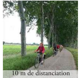
10 m de distanciation

Notre « maison » dans les sacoches, nos escapades ont fait découvrir aux participants voies vertes et petites routes cyclables le long de la Garonne ou bien du Tarn, par un week-end à Revel, St Ferréol ou en cyclotourisme dans l'Aveyron. Un pur plaisir, des mini-vacances saines et ressourçantes dans le respect de l'environnement et des conditions sanitaires.