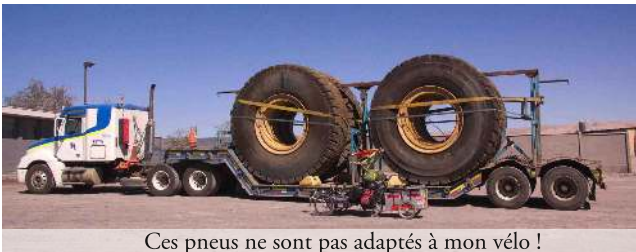
Ces pneus ne sont pas adaptés à mon vélo !