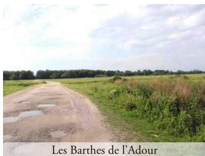
Les Barthes de l'Adour

On continue sur la digue longeant le fleuve, avec de belles vues sur l'Adour et les Barthes, et arrive à Saubusse, au pont de la D17 (Km 28) avec une halte possible au bord de l'eau (tables-bancs). Joli port et quais de l'Adour. Bars-restaurants. Voir la Galupe « Bayoune », bateau que la Mairie est en train de rénover pour qu'elle navigue sur l'Adour.