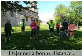
Déjeuner à bonne distance..

La tête de file devait être rapide pour que le groupe s'étire, un peu de tâtonnement mais très vite les habitudes ont été prises.