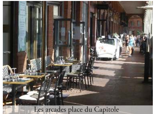
Les arcades place du Capitole

Que dire aussi pour le déplacement des PMR rendu très compliqué en certains endroits ?