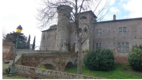
château de Tarabel

Tarabel vaut bien une petite pause et un coup d'œil au vieux village et à son château qui est habité depuis plusieurs générations par la même famille.