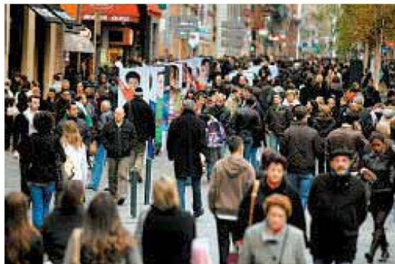
L'affluence était importante dans la principale artère toulousaine.

nant, nous avons bien plus de trafic et enfin les familles, qui avaient tant de mal auparavant avec l'étroitesse des trottoirs.»