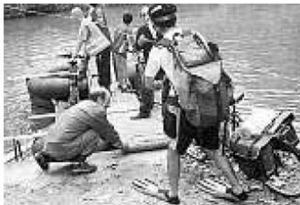
Des cyclistes complètement palmés!