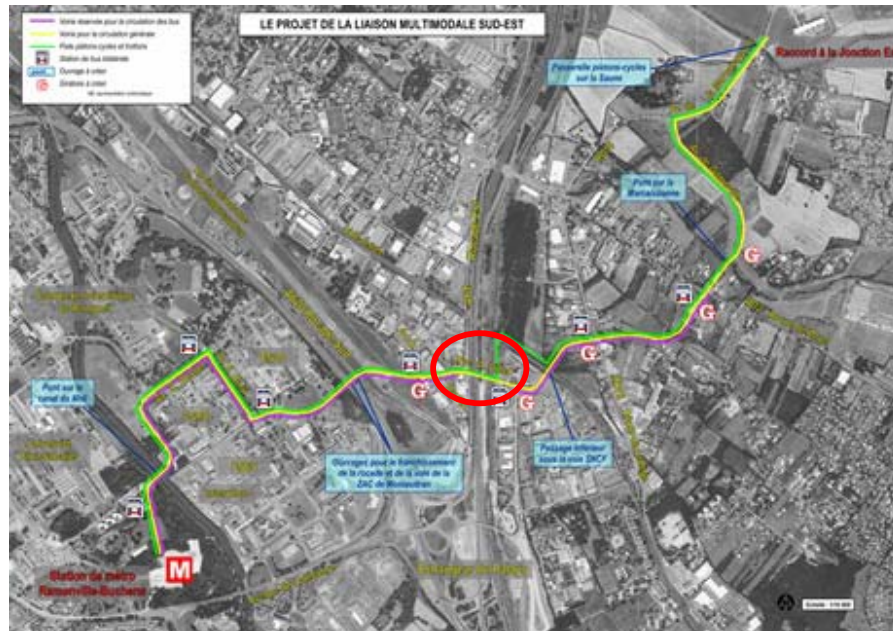
Figure 1 : Tracé global de la LMSE tel que prévu par le Grand Toulouse

Le Grand Toulouse est le Maître d'Ouvrage d'une nouvelle liaison urbaine, entre le terminus de la future ligne B de métro à Ramonville et l'avenue de la Marcaissonne à l'entrée de Quint-Fonsegrives (voir la figure 1). Dénommée Liaison Multimodale Sud-Est (LMSE), la LMSE est inscrite au Schéma Directeur de l'Agglomération Toulousaine et au Plan de Déplacements Urbains comme projet prioritaire, à réaliser pour 2008. Plus d'informations sont disponibles sur le site Internet du Grand Toulouse à l'adresse: http://www.grandtoulouse.org .