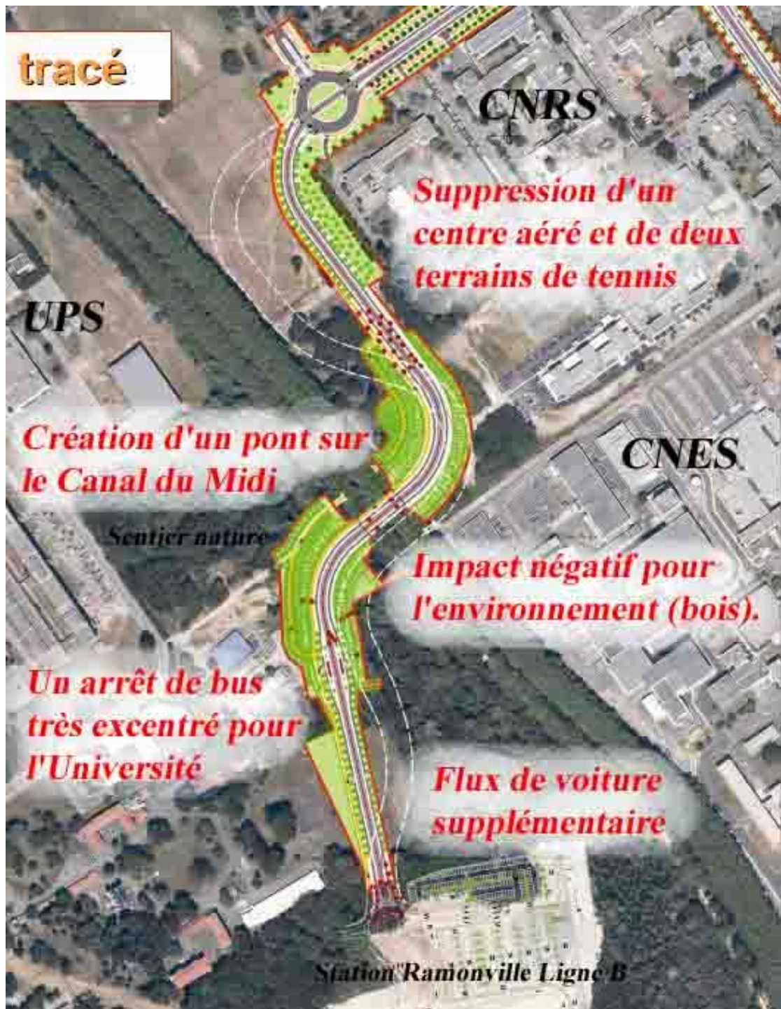
Fig. 3 : Impact de la LMSE, telle que prévue par le Grand Toulouse, sur la zone du Canal du Midi vers l'Université Paul Sabatier

En particulier, le projet du Grand Toulouse prévoit la construction d'un nouveau pont en travers du Canal du Midi, classé au Patrimoine de l'UNESCO, au niveau de la zone boisée du Sentier Nature (voir la figure 3).