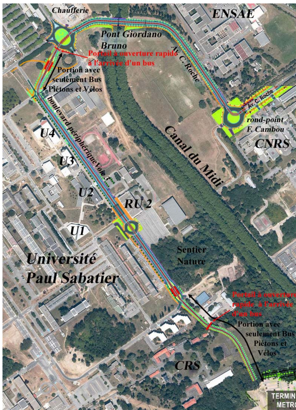
Fig. 4 : La variante proposée par Veracruz au niveau du Canal du Midi et de l'UPS.

Une variante est proposée par Veracruz, l'association naturaliste/écologiste de l'Université Paul Sabatier Toulouse III, entre le futur terminus de la ligne B du métro sur la commune de Ramonville et le rond-point Cambou sur la commune de Toulouse en empruntant le boulevard extérieur de l'Université Paul Sabatier (UPS) et l'avenue du Colonel Roche. Le dossier de Veracruz est disponible à http://veracruz.over-blog.net/article-1227062.html