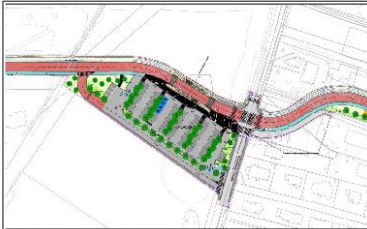
TCSP de la VCSM/ les plans n'indiquent aucun aménagement cyclable le long du chemin de Larramet/Tucaud pour rejoindre le nouvel équipement.

Les participants à cette réunion ont apprécié la qualité des échanges, et la bonne coopération avec des objectifs communs notamment en matière d'accidentologie : réduire les risques et avancer ensemble vers plus de prévention.