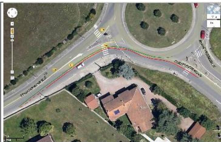
Aménagement alternatif / Franchissement du rond-point de Pirac Séparation des flux en amont avec création d'une voie dédiée au tourne à droite (délimitée par la ligne rouge) et d'un itinéraire cycliste (en vert) pour aller tout droit