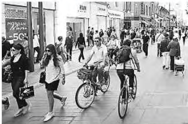
Piétons et cyclistes rue Alsace, cohabitation parfois difficile.