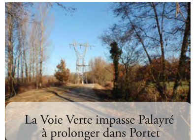
La Voie Verte impasse Palayré à prolonger dans Portet

est réalisée de Roquefort à Montréjeau (parcours commun avec la V83). Il faut réaliser la liaison avec l'Ariège par la vallée du Salat : 20km entre Roquefort-sur-Garonne/Salies-du-Salat/Lacave, avec 10km en Voie Verte sur l'ancienne voie ferrée, propriété du Département !!. Cette Voie Verte est prioritaire.