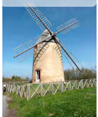
Le moulin de Montbrun

13h Départ pour Nailloux : 18 kms de route un peu vallonnée; après être redescendu du Moulin on prend à gauche la D91 puis après avoir traversé ISSUS et la D19 on continue sur la D91 en laissant successivement sur notre droite la Bruyere, Auragne, Daujas;