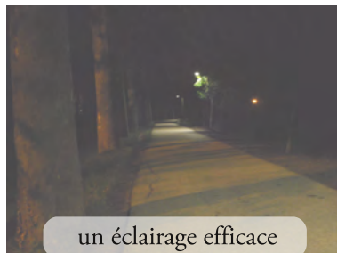
un éclairage efficace