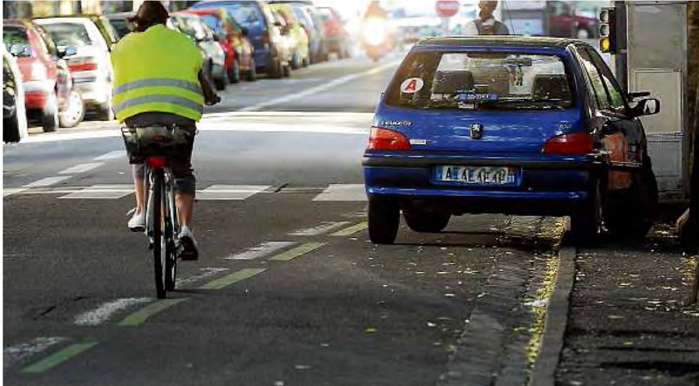
Le fléau des voitures garées sur les pistes cyclables persiste, ici avenue Honoré Serres à Toulouse.