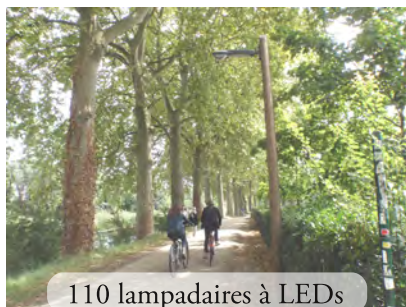
110 lampadaires à LEDs

Un état des lieux détaillé de l'éclairage de cette Voie Verte (inventaire au 15 Août 2015) a été transmis à Toulouse Métropole.