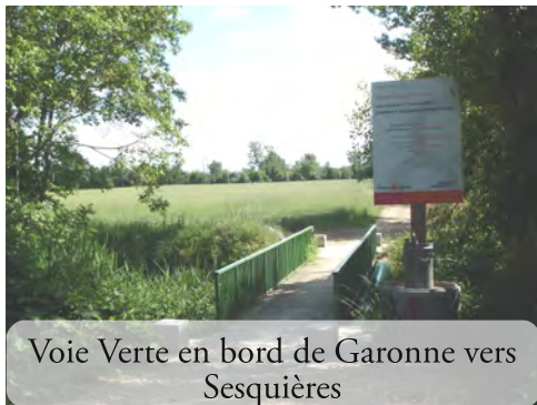
Voie Verte en bord de Garonne vers Sesquières

Rappel : l'Association Vélo, devenue Deux Pieds Deux Roues, délégation régionale de l'AF3V, agit pour cette « Voie Verte de la Garonne » depuis 15 ans.