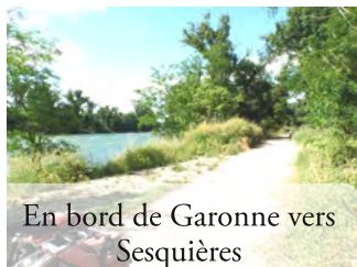
En bord de Garonne vers Sesquières

La section suivante est très agréable, bien ombragée, et sera améliorée en 2015 sur 4km : revêtement en grave, tables, bancs, panneaux d'information. Après avoir traversé un camp de gens du voyage plus propre et plus calme qu'auparavant, et après Les Jardins de l'Olympe, on arrive au : Vieux pont de Blagnac (Km 12,5) . On rejoint la place du Capitole par le même chemin qu'à l'aller. Place du Capitole (Km 18)