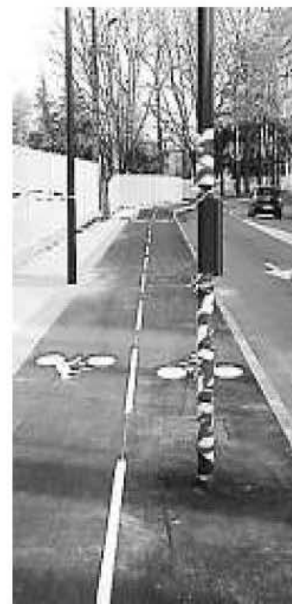
Deux photos de Sébastien Bosvieux, pour le concours de TerraEco. / Photo DDM