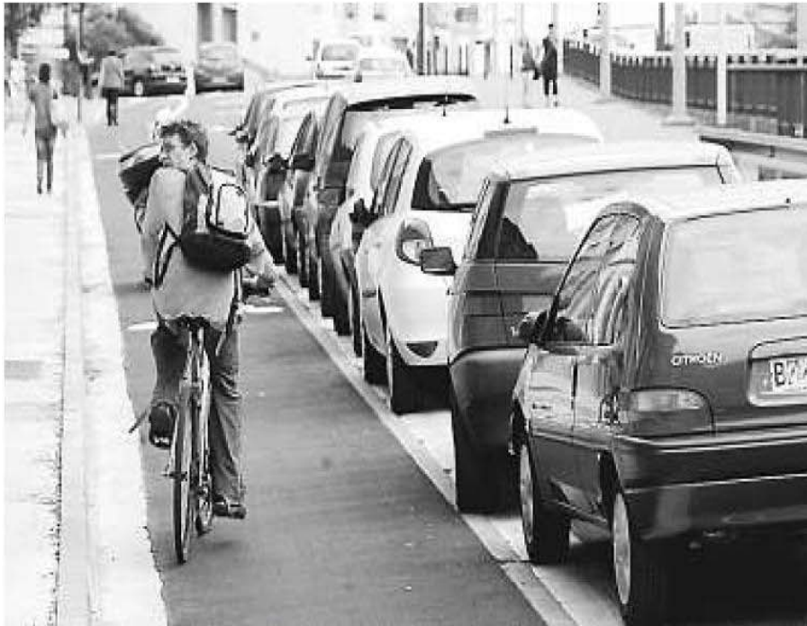
Le nombre de cyclistes est en constante augmentation.

Le magazine TerraEco a placé Toulouse en troisième position de son palmarès des villes françaises où il fait bon pédaler. Un résultat qui récompense les efforts entrepris.