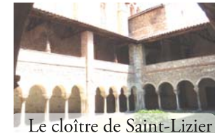
Le cloître de Saint-Lizier

Départ : Roquefort-sur-Garonne, carrefour D13/D13-E - Pont (km 0).