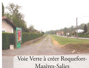
Voie Verte à créer Roquefort-Mazères-Salies