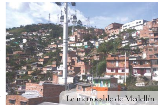
Le metrocable de Medellín

http://www.grandpedaleurlibre.org/index.php?option=com_content&view=category&id=53&Itemid=72