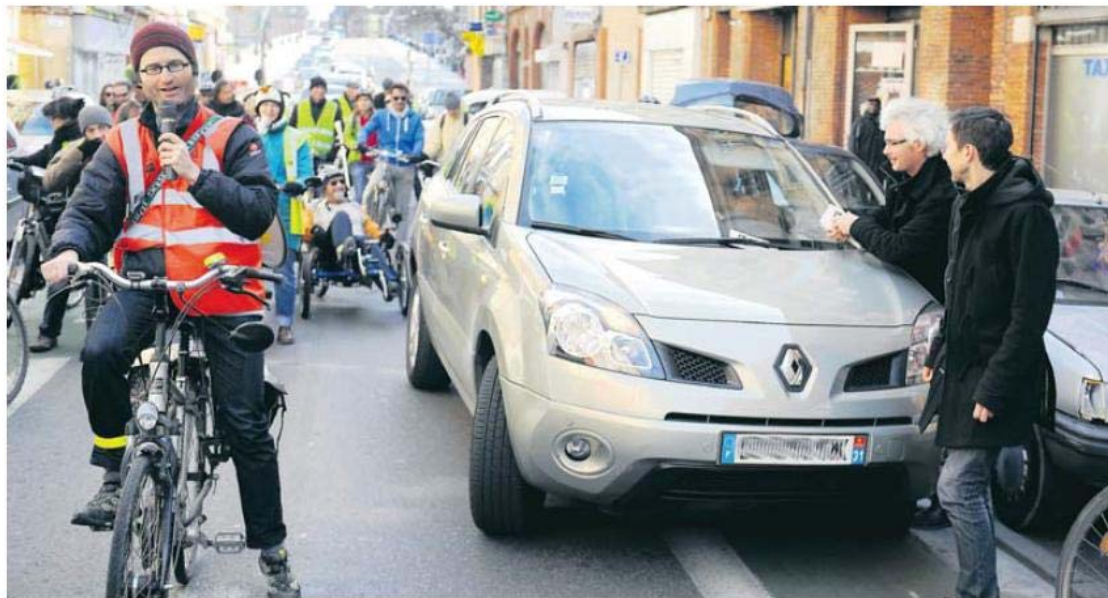
Les membres de l'association Vélo ont manifesté le week-end dernier contre les automobilistes peu respectueux.

À quoi servent les pistes cyclables si elles sont encombrées par les voitures ? Ras-le-bol disent les cyclistes qui se mobilisent contre ce fléau.