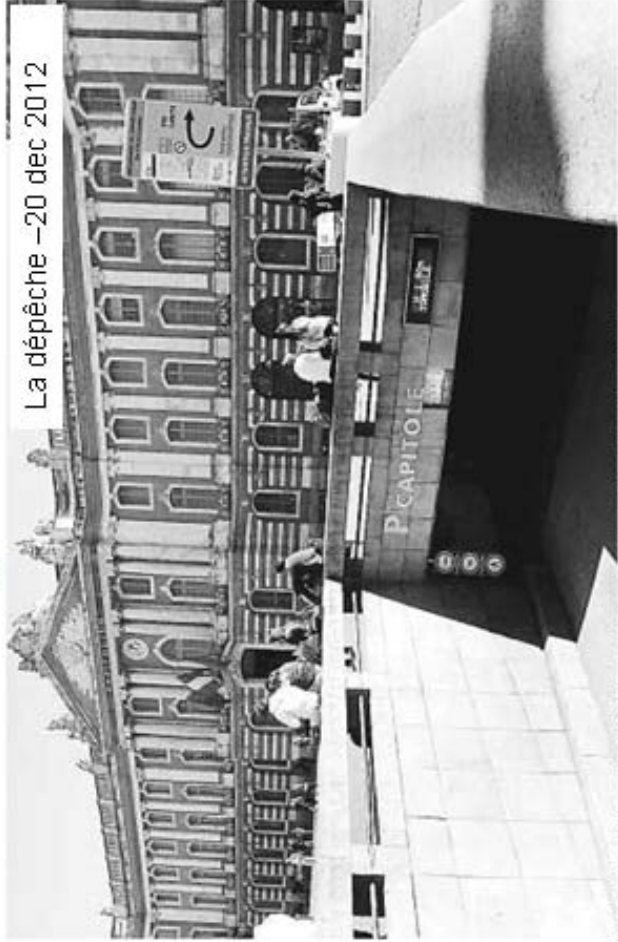
Entrée et la sortie du parking du Capitole seront par ailleurs inversées fin avril 2013.

essentiel A partir du 1er janvier, les habitants de l'hypercentre bénéficieront d'un tarif réduit au parking du Capitole. Une réponse à la suppression de places de stationnement.