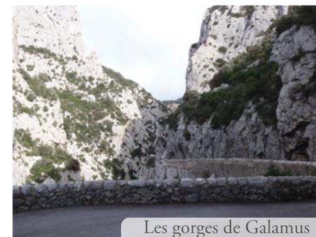
Les gorges de Galamus

En 2013, avec la même équipe, nous organisons une troisième randonnée vélo "militante" du lundi 1er au vendredi 12 juillet .