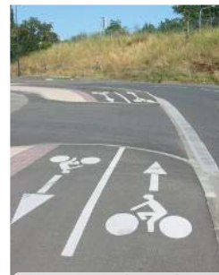
une piste sécurisée ne devrait pas s'interrompre

Côté points positifs, le double-sens cyclable en centre-ville s'avère également être un dispositif sûr, malgré une appréhension chez certains automobilistes et cyclistes.