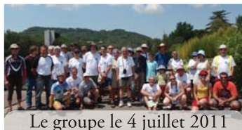
Le groupe le 4 juillet 2011

Vous pouvez déjà réserver ces dates et vous pré-inscrire !