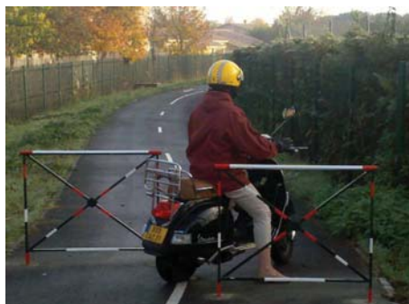
Des barrières dangereuses et inefficaces pour empêcher les scooters de passer