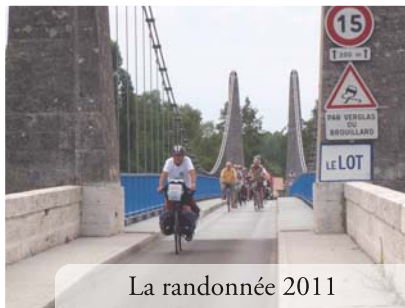
La randonnée 2011

En juillet 2011 l'association Vélo, Délégation régionale de l'AF3V, a organisé une randonnée vélo "militante" pour promouvoir la Véloroute de la vallée du Lot. 30 cyclo-randonneurs ont pédalé 10 jours sur 700 km, d'Aiguillon aux sources du Lot. C'était une première réussite.