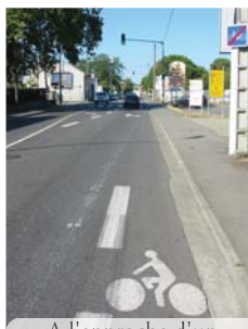
A l'approche d'un carrefour, l'aménagement devrait être soigné

Il est également intéressant de noter que c'est à Tournefeuille que la part des vélos impliqués est la plus importante (dans 22% des accidents). Si la pratique du vélo y est bien développée, cela tend aussi à montrer que la piste cyclable séparée du trafic (répandue là-bas) n'est pas systématiquement l'aménagement idéal, elle peut se révéler accidentogène dans les intersections.