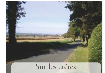
Sur les crêtes

Cartes conseillées: IGN n°2343-0, 2243-E et 2243-O