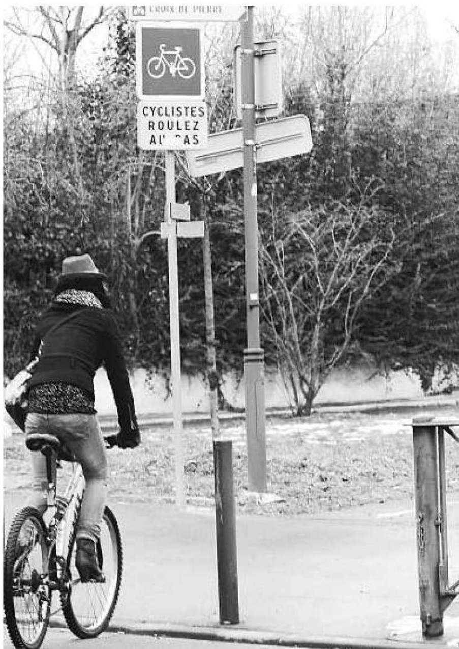
Des bordures gênantes, comme ici sur la piste rive gauche de la Garonne.

axes soient aménagés en priorité avec bordures abaissées, les fameux « bateaux zéro » qu'on peut voir notamment sur la piste du pont du Stadium (pont Pierre de Coubertin).